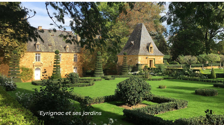
Eyrignac et ses jardins

Promouvoir le Pays de Fénelon c'est mettre en avant le Périgord Noir tel qu'il se présente dans l'imaginaire de nos visiteurs : riche; authentique, intense