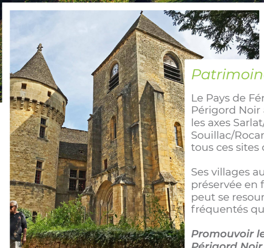
Château de Saint-Geniès et ses toits de lauzes